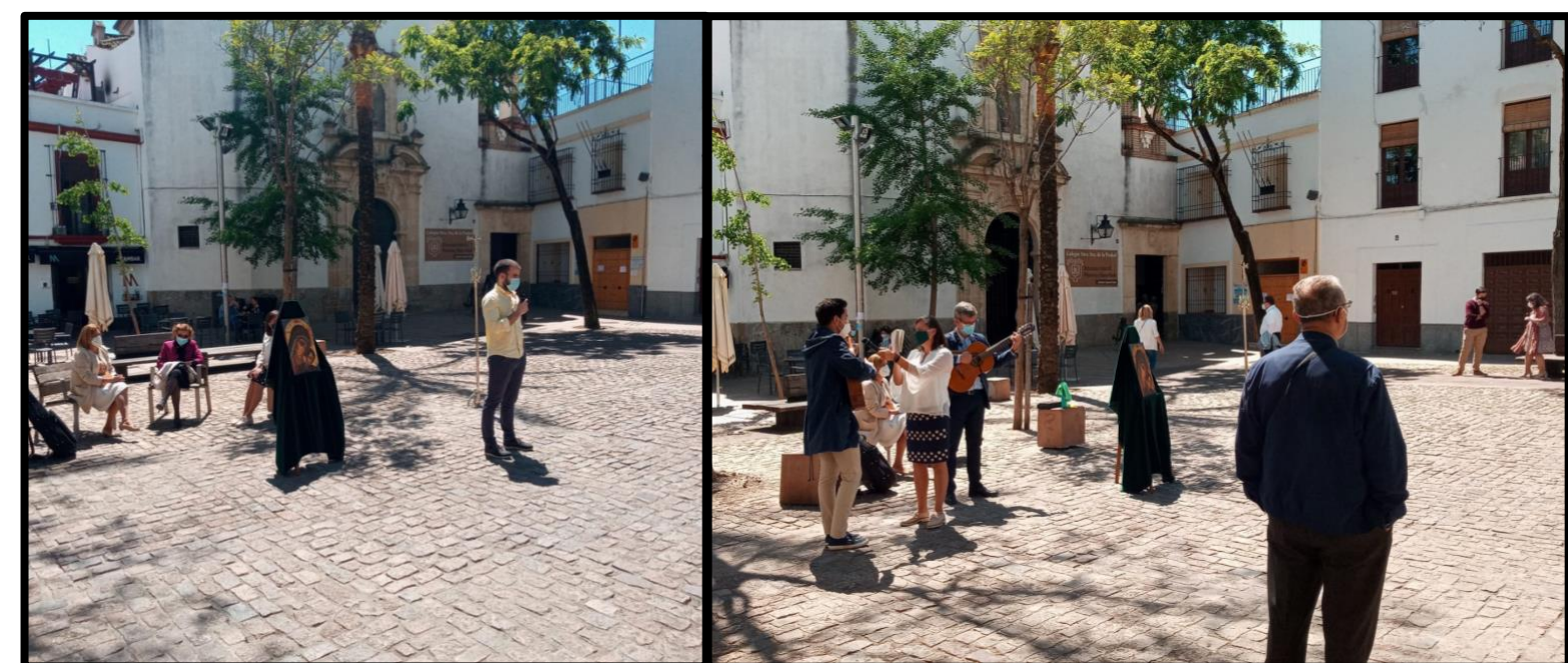
Plaza de las Cañas