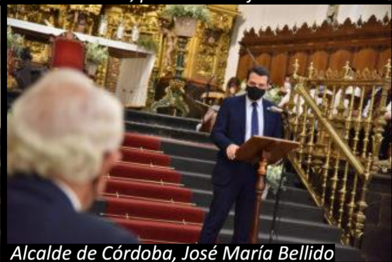
Alcalde de Córdoba, José María Bellido

PINCHE AQUÍ para ver video del acto de inauguración PINCHE AQUÍ para ver video explicativo