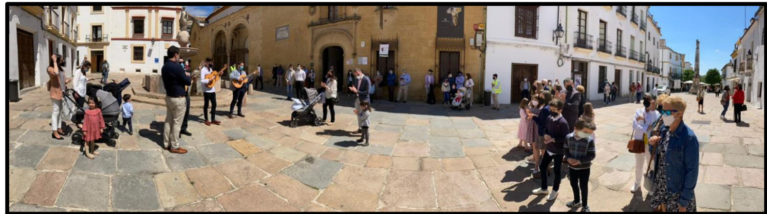
Plaza del Potro