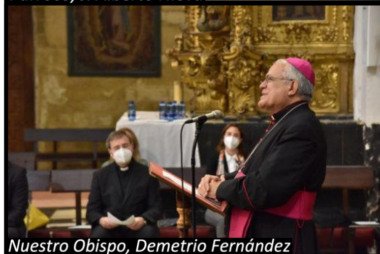
Nuestro Obispo, Demetrio Fernández